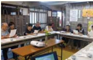
回想法講座の様子