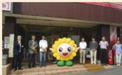
オープニングセレモニーの様子

南区役所1階で行われている「ひまわり横丁」が南区役所を飛び出し、パティスリードゥ・ド・ボワで授産製品やあいあい・まいまいグッズを常時販売することとなり、4月28日(火)にオープニングセレモニーがありました!