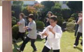
健康太極拳 同好会